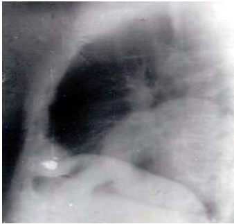
Fig. 1. Radiografía lateral de tórax

ECG: Taquicardia sinusal. Radiografía lateral de tórax: tumoración de 12 cm aproximadamente en base del pulmón izquierdo, redondeada, sin calcificaciones ni derrame asociado (Fig. 1).