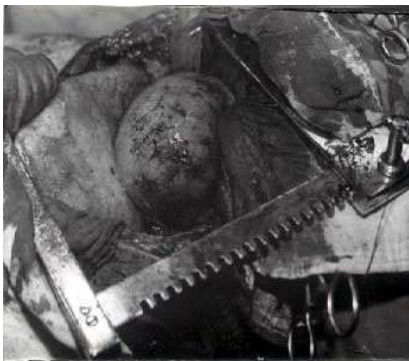
Fig. 3. Acto quirúrgico que muestra el tumor interlobar

No se presentó derrame pleural ni alteraciones en las estructuras óseas. Se decidió tratamiento quirúrgico (Fig. 3), se encontró un gran tumor a expensas de la pleura, con aspecto que recuerda el tejido pulmonar de consistencia esponjosa.