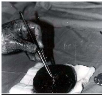
Figs. 4 y 5. Características macroscópicas del tumor una vez extraído y el corte del mismo